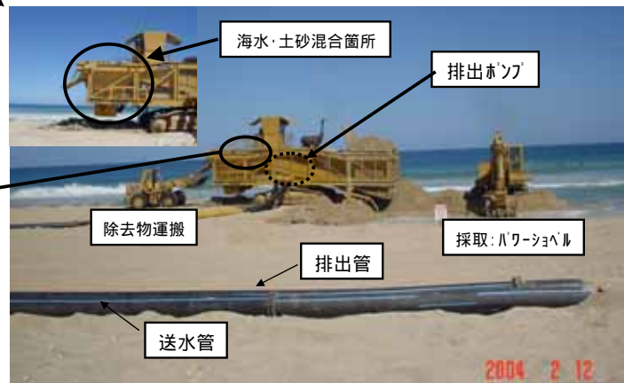
サンドバイパス用施工機械（スラリートラック：移動可）