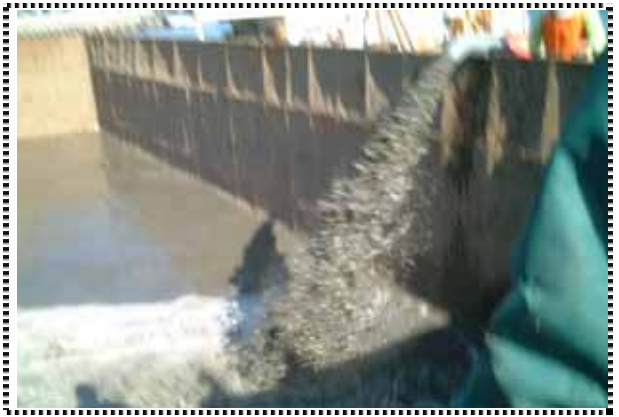
写真2 除去泥水 ( ~ )