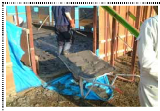
写真3 沈殿泥 ( )