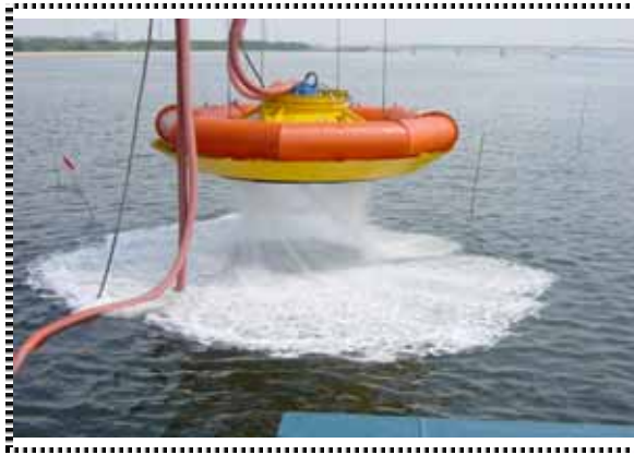
写真1 除去装置 ( )