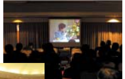
◀ パネル ディスカッション