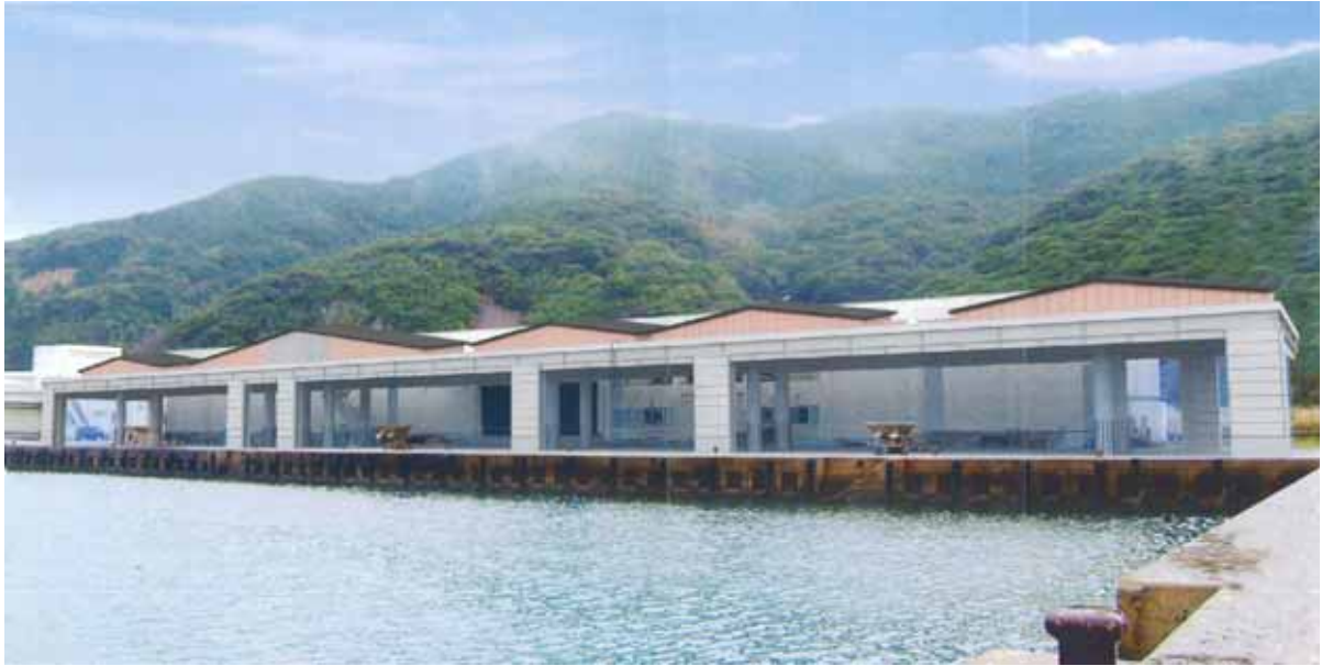
図-5 完成予想パース図