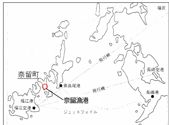
図-1 奈留漁港位置図

このような情勢を踏まえ、奈留島の漁業は、限られた水産資源下において漁獲数量優先から品質・価格重視への構造転換期を迎え、平成 15 年度に奈留地区における衛生管理計画の検討を行うに至った。