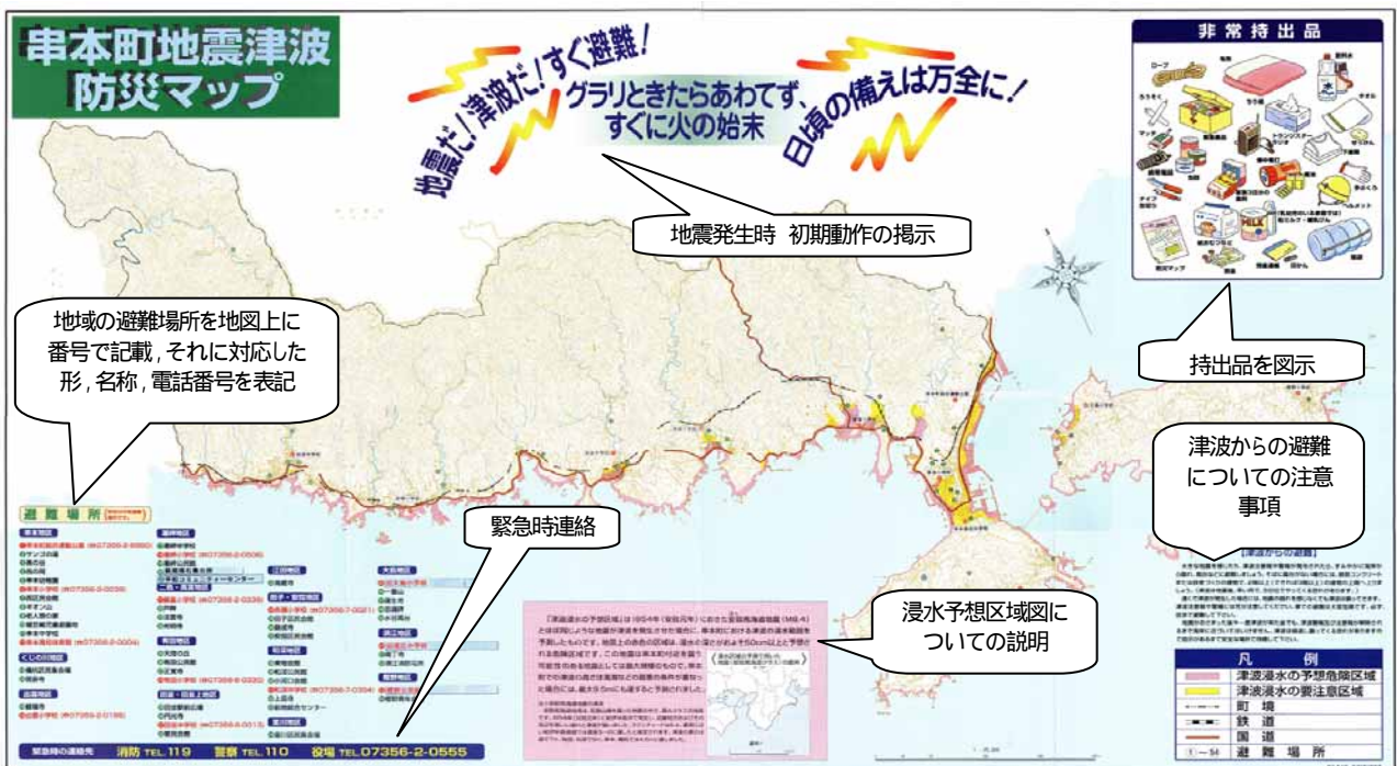
図-2 地震津波防災マップ事例(A0変形版)