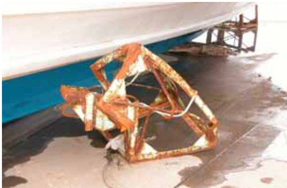
写真-2 座屈した架台(H15 十勝沖地震)

静穏度の悪い漁港では、舟の傷みを少なくするため、休漁期等は、漁船を陸置きするケースが多い。スロープ上に直に置かれる場合や、(写真-2)の様な簡易な台に載せられる場合もあり、地震時に落下し破損するケース(写真-3)や、津波により流出あるいは、家屋へ衝突し被害を及ぼすケースが見られる。