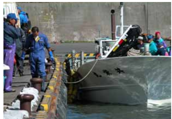
写真-4 岸壁の被災(H15 十勝沖地震)

さらに、漁港への主要道路が、液状化や土砂災害により寸断され、水産品の輸送に支障が生じる場合や、付近に代替道路がない場合、長期に亘って漁港や漁村が孤立する恐れがある。