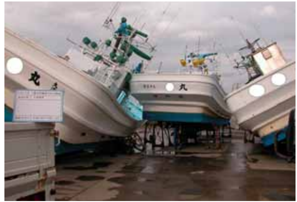
写真-3 架台より落下・転倒した漁船 (H15 十勝沖地震)