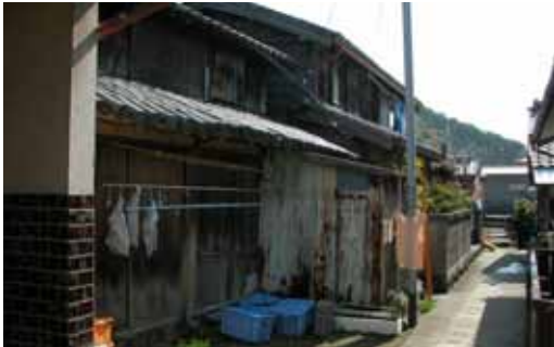
写真-1 狭い道幅（由岐町）

漁港は港湾に比べ数が多く、その背後には生活空間としての集落が存在する。漁業従事者は、漁船・漁具の取り扱いなど日々の生活や生産活動上の利便性から漁港周辺の低地に居住する傾向があり、津波の被害を受ける危険性が高い。また、古い漁村集落は、入り江等狭隘な場所に形成されたものが多く、家屋が密集し道路幅も狭く、入込んだ構造で車の通行に支障のある場所も多い。